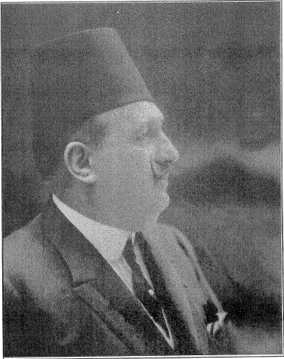
الملك أحمد هؤاد لم يتورع عن حل البرلمان فى أول يوم انعقاده